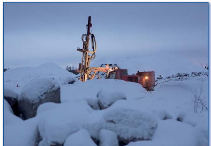
Přípravné práce – budování cesty na poloostrov Hanhikivi, leden 2015.