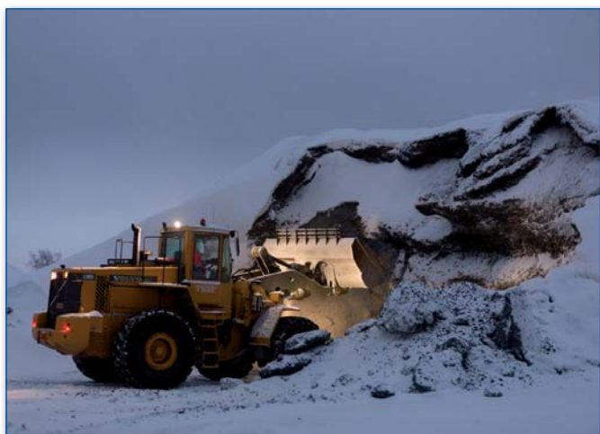
Přípravné práce – budování cesty na poloostrov Hanhikivi, leden 2015.